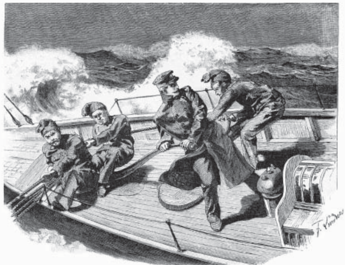
„Hol an Großschot!“ Nach einer Zeichnung von Ferdinand Lindner

Leser wird aus der Zahl der angeführten Unfälle leicht entnehmen können, dass es der ganzen Aufmerksamkeit und Energie der Segler bedurfte, um die Fahrzeuge sicher durch den Wogenschwalm zu führen. Bei den Kursen mit raumem Winde stiegen die Beisegel an den Masten empor, ungeheure Flächen Leinwand, von der Spitze der Stengen bis zum Wasser reichend, wurden dem Winde dargeboten und ließen die Jachten mit vermehrter Schnelligkeit dahinfliegen. Keine Minute, keine Sekunde durfte verloren gehen, da die geringste Zeitdifferenz Sieg oder Niederlage bedeutet.